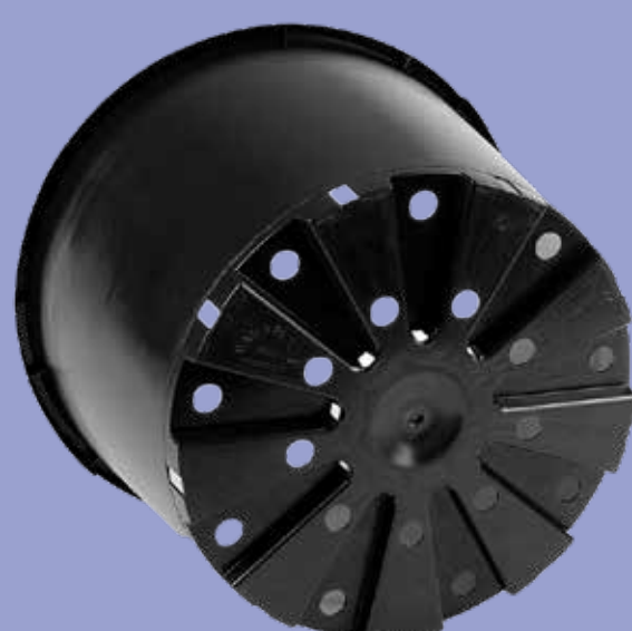
40/MR 35 lt.