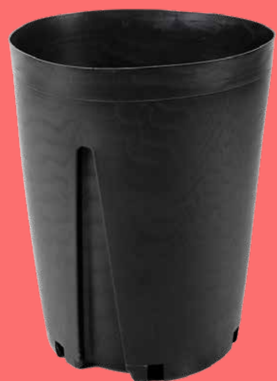
Vaso Vivaio Lungo 20/L