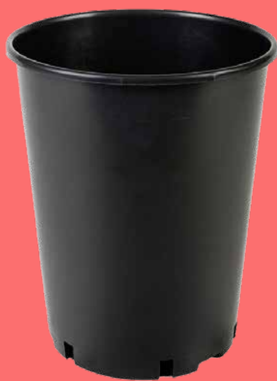
Vaso Vivaio Lungo 18/L

Scegli la qualità e l'affidabilità del vaso Lungo Vivaio per ottenere i migliori risultati per le tue piante da frutto!